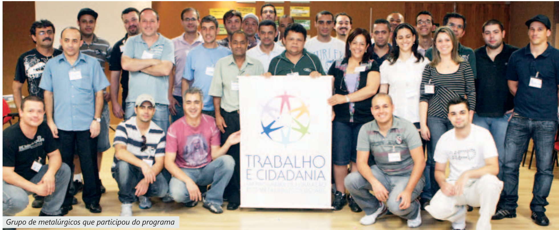
Grupo de metalúrgicos que participou do programa