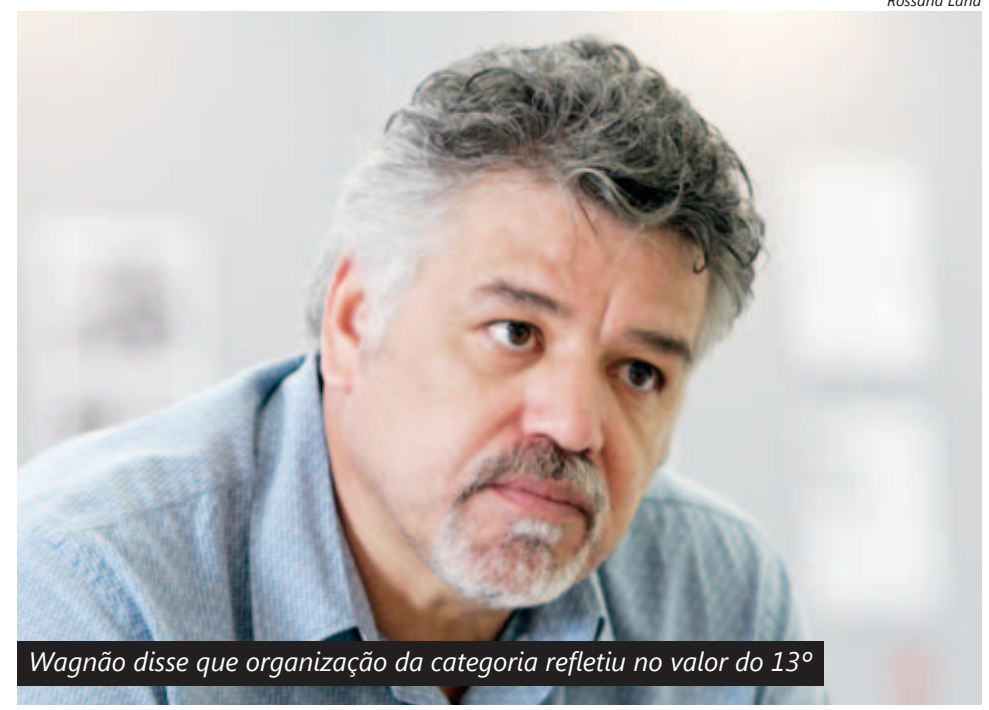
Wagnão disse que organização da categoria refletiu no valor do 13º

Dos R$ 419 milhões a serem recebidos pela categoria, R$ 304 milhões são dos metalúrgicos do setor automotivo, reunindo trabalhadores em montadoras e autopeças.